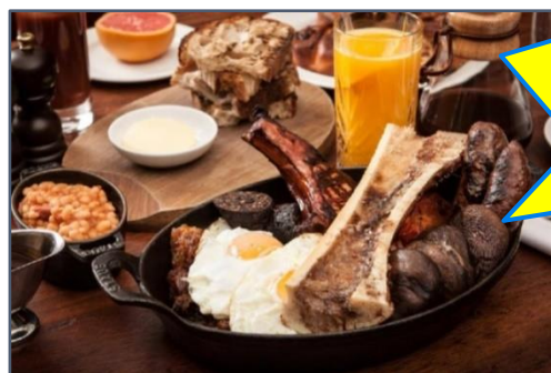
The Full English

Het vlaggenschip Scharnhorst werd om 16:04 uur zwaar getroffen en verging om 16:17 uur met man en muis. Alle opvarenden verdronken, waaronder ook admiraal graaf Von Spee en zijn beide zonen. In totaal overleefden 2200 Duitse zeelui de slag niet.