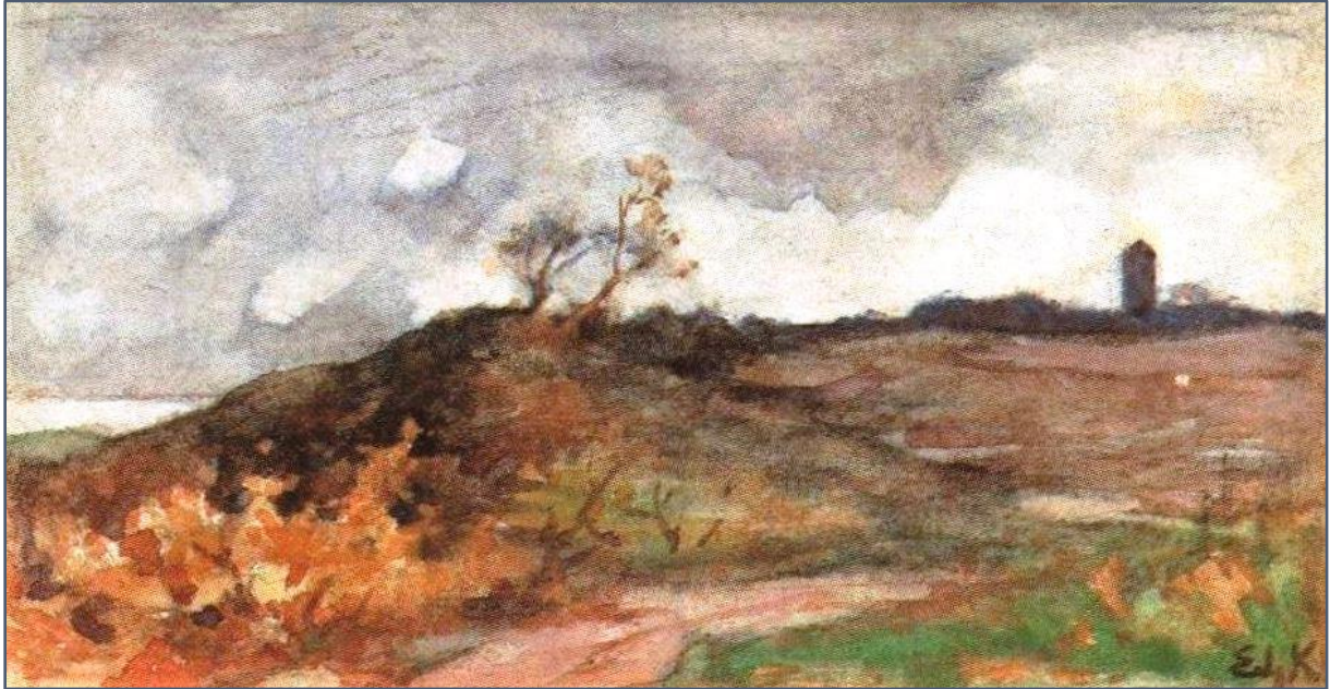
Nije Mirdumer Klif

Dan bereik ik het dorpje Nebel, dat van een ongelooflijke popperigheid is. Vol met Hans en Grietje huizen omgeven door tuinen overdadig vol met rozen. Alles wil de indruk wekken van Gemütlichkeit und keine Sorgen. Daar komen wij natuurlijk niet voor. Gelukkig is er ook een kerkhof, met berichten vanuit het echte leven. Allereerst de graven van zeelui. Sommige gesierd met prachtige driemasters en met de wind vol in de zeilen. Mooier nog en in elk geval melancholischer is de wat losstaande hoek voor de “onbekannter Seeman”, het “Friedhof der Namenlosen”. Ook wel het “Friedhof der Heimatlosen” genoemd.