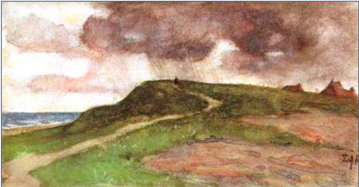
Het Roode Klif

Achter deze duinen ligt de overgangszone naar het pleistoceen met heel erg het karakter van oude duinen. Veel ervan is met naaldbos bedekt. Daar waar het open is, heb ik zicht op een kleurige korte vegetatie waarin nu soorten als echt walstro, Engels gras, duizendblad en hazenpootje. Ook stuit ik hier en daar op heideveldjes waar bonte kraaien rauw roepen.