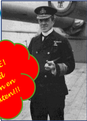
Sir Frederick Charles Doveton Sturdee

plaats aangekomen en lag in de haven van Stanley, de hoofdstad van de Falklands, aangemeerd om opnieuw kolen te bunkeren.