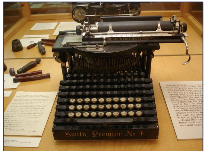
schrijfmachine van Hermann Hesse

De ingang van de begraafplaats 'der Heimatlosen' (staatlozen, ontheemden, onbekende zeemannen) in Nebel op Amrum. De begraafplaats is op initiatief van strandvoogd Kapitein Carl Jessen in 1905 aangelegd. De eerste begrafenis van een aangespoelde zeeman vond plaats op 23 augustus 1906, de laatste op 4 juni 1969.