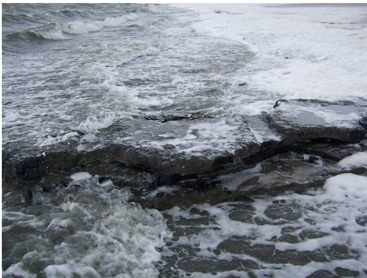
figuur 9 Wielspoor (?) in oude kleilaag nabij Simonszand