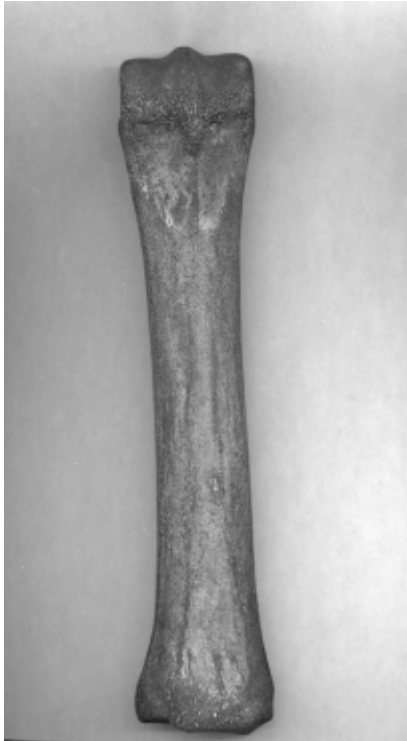
figuur 6 Middervoetsbeen van een paard, gevonden op het oosteinde van het eiland Juist. De zwarte kleur is veroorzaakt door een lang verblijf in de bodem