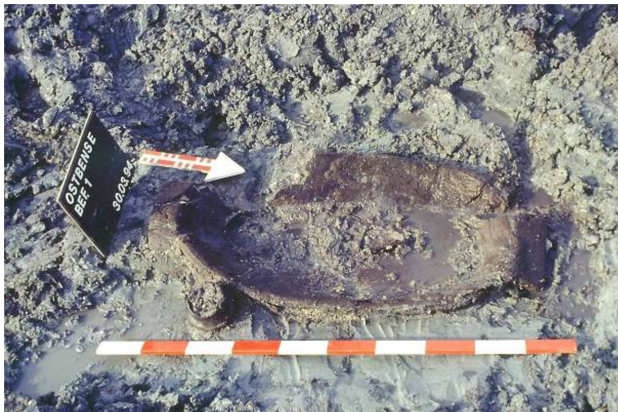
figuur 10 Zuigelingengraf in houten schaal op het Wad bij Esens, vroege Middeleeuwen