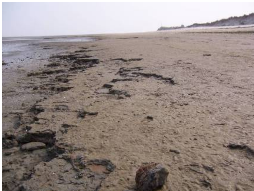
figuur 8 Kleilagen van een oude kwelder komen weer tevoorschijn (Noordzeestrand Rottumerplaat)