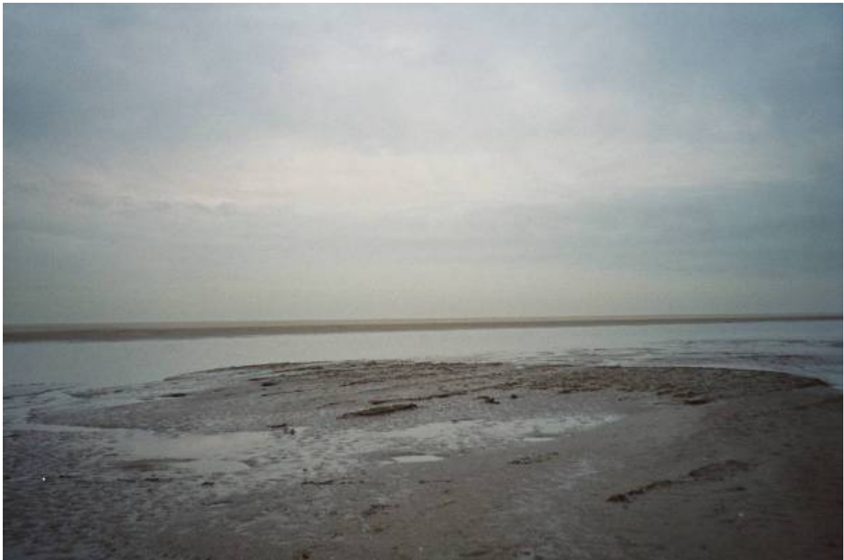
figuur 1 Cultuursporen (akkergreppels?) nabij Schiermonnikoog