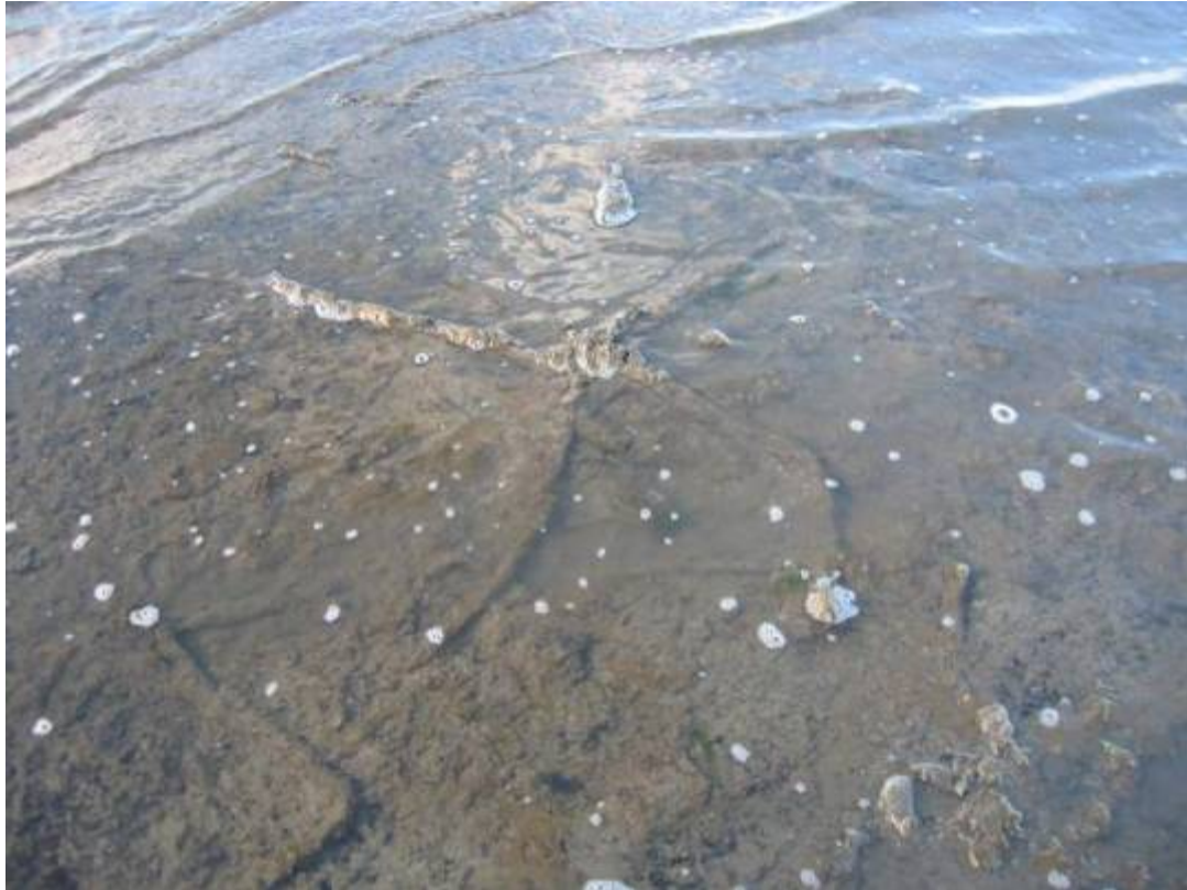
figuur 3 Wortelstelsels van elzen op het Wad bij Esens (Duitsland)