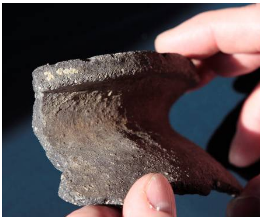
figuur 11 Scherf van een kogelpot uit de 12 e of 13 e eeuw (westrand Rottumerplaat, maart 2007)