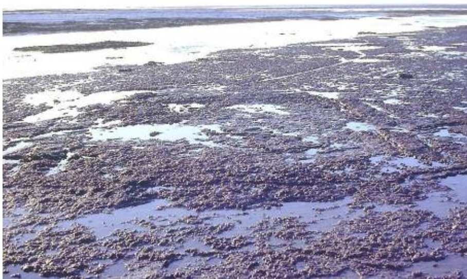
figuur 4 Veenbodem op het Wad bij Esens met fundamente van een huis, Romeinse tijd