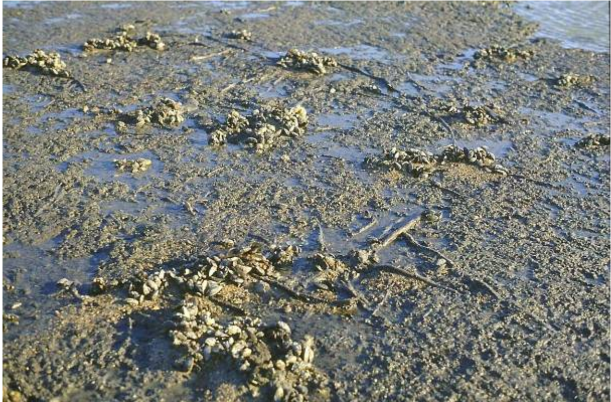
figuur 5 Wortelstelsels, met daarop mosseltjes, op het wad bij Esens