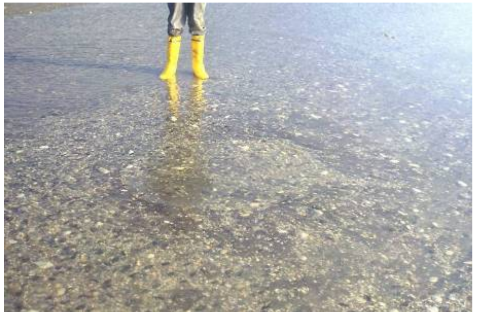
figuur 7 Contouren van een waterput waarvan de wand was opgebouwd uit zoden