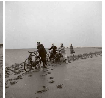
De foto's van bemoderde voetgangers op het Wad en op de Holwerder pier dateren van 1951. Het amfibievoertuig werd in 1952 vastgelegd. In dat jaar werd ook een bezoek van een groep militairen aan Ameland vastgelegd (rechtsonder), evenals de hengeleende man bij Holwerd.