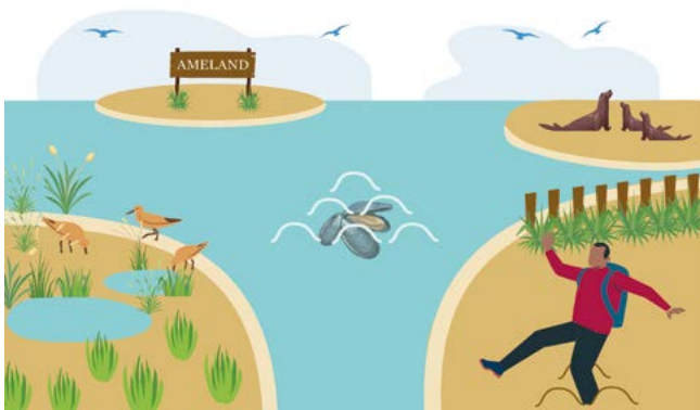
Onderdelen van het wad

in op het omgaan met verschillende risico's en calamiteiten op het Wad. Deze e-learning is gratis en vrijblijvend te doorlopen.